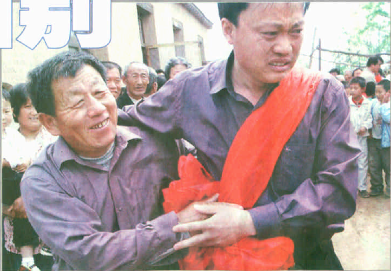
在利津县虎滩乡北苏村，市科技局包扶队员们面对前来相送的乡亲们，挥泪洒别。

从2001年11月从市直机关各部门选派302名机关干部进驻全市99个经济落后村开展包村扶贫工作，在一年半的时间里，包扶队员们不负重托，扎实苦干，帮助基层建班子，办实事，帮民富，促进了农村经济和社会各项事业的全面发展，赢得了基层干部群众的广泛赞誉。5月23日，完成预期包扶目标的包扶队员们陆续撤离，闻讯而来的乡亲们依依不舍，挥泪相送。