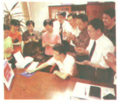
全省首家青年人才交流网站在我市开通

合法运销。四是充实地方粮食储备，增强政府调控能力。市及各县按照国务院和省政府“关于销区保持6个月销量”的地方储备粮要求，根据“当地城镇非农业人口、军队、缺粮农民、城市流动人口等”需吃商品粮人口数量，充实地方粮食储备。（于新生）