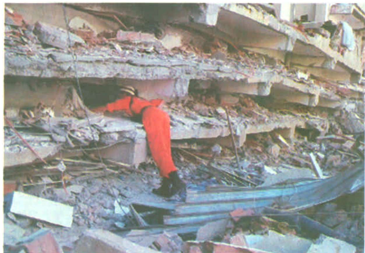
5月23日，来自瑞士的一人道主义救援人员在阿尔及利亚首都阿尔及尔以东35公里的一处坍塌的四层楼房废墟上搜寻幸存者。目前，至少1200多人在阿尔及利亚发生的地震中死亡，7000多人受伤。

秘鲁 当地时间5月28日下午4点26分（北京时间29日凌晨5点26分），秘鲁首都利马发生了里氏5.1级强震。截止到目前为止，财产损失情况不详，警方尚未接到有人受伤的报告。据报道，秘鲁国家地球物理研究所说，震中位于太平洋海底51公里处，距离秘鲁海滨城市奇卡以西48公里。